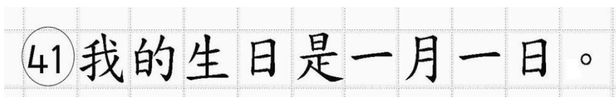
Рис.16. Образец написания иероглифических знаков

Бланк ответов № 2 (лист 1 и лист 2) по китайскому языку (рис. 14 и рис. 15) предназначен для записи ответов на задания КИМ для проведения ЕГЭ с развернутым ответом по китайскому языку (строго в соответствии с требованиями инструкции к КИМ для проведения ЕГЭ и к отдельным заданиям КИМ). Каждый иероглифический знак и каждый знак препинания следует писать внутри отдельной клетки в поле ответов бланка ответов № 2 (дополнительного бланка ответов № 2) (рис. 16).